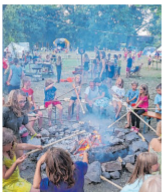
Rustikal: Der CVJM lädt in Nettelstedt zum Zirkusabend ein.

Der CVJM freut sich auf viele interessierte Gäste aus Nettelstedt und Umgebung. Der Abend ist kostenlos, über Spenden an Futterständen und fürs Konzert würde sich der CVJM freuen. Weitere Infos erhalten Interessierte bei Jugendreferent Bodo Borchard unter Tel. (0 57 41) 45 83, (0151) 12438498 oder per E-Mail info@cvjm-luebbecke.de