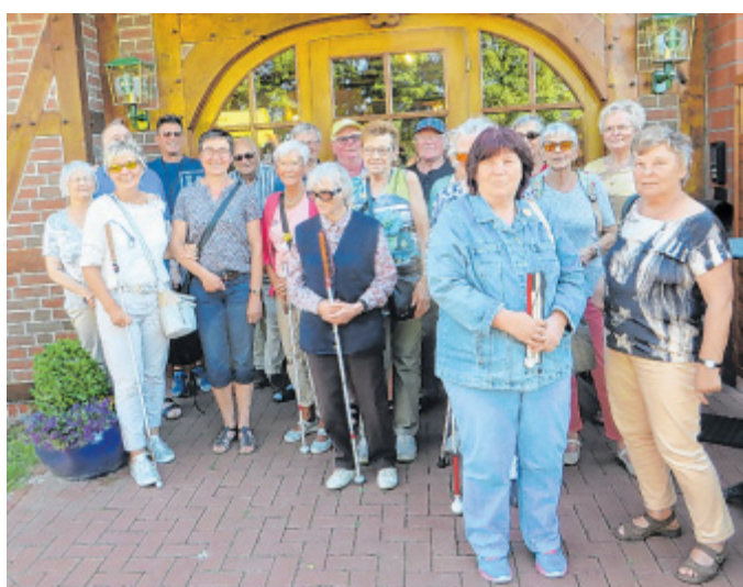
Ausflug nach Varl: Mitglieder und Freunde des Blinden- und Sehbehindertenvereins auf Tour.

mer nach diesem schönen gemeinsamen Tag, der allen viel Spaß gemacht hat, galt den Begleitpersonen und Hilke Voller.